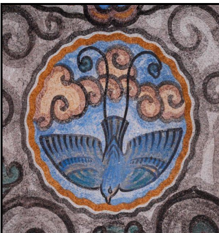
De två målningarna t.v. är från Engelbrektskyrkans vigselrum, de två t.h. från hallen i en av femmorna på Birger Jarlsgatan 83 – ej renoverade.